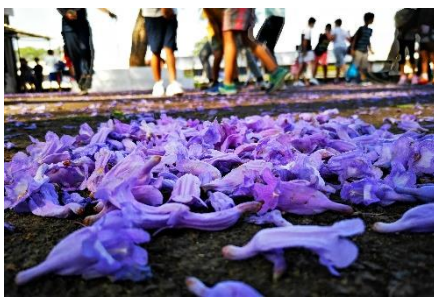
Tapis de fleur de jacaranda en récréation CM1 CM2 C EPF B Tana