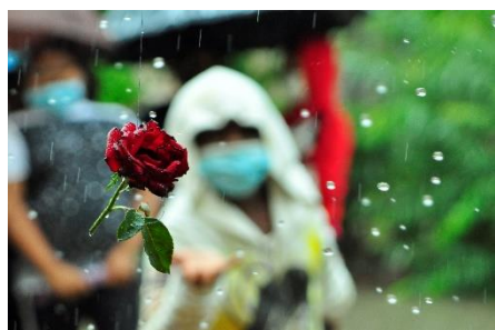
Je t'envoie une rose de l'amitié CM2 Collèges de France

Voici les 3 photos plébiscitées par le jury pour le CYCLE 3 (sans classement)