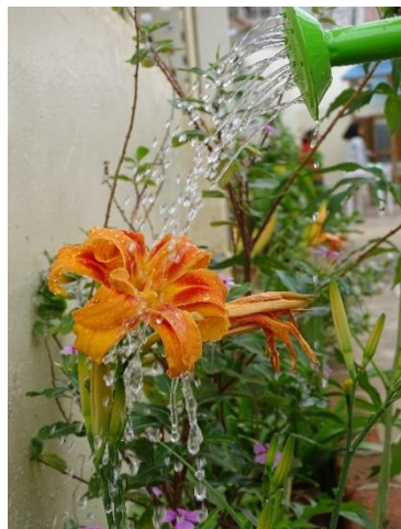
CE1A Laclairfontaine Ivandry

Voici les 3 photos plébiscitées par le jury pour le CYCLE 2 (sans classement)