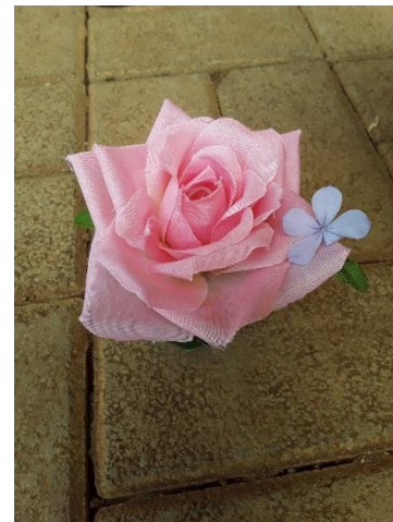
CP3 Paul et Virginie Maurice