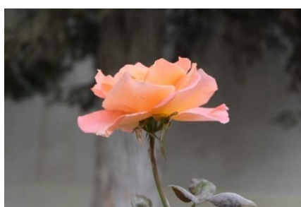
La rose seule au monde CM2 EPFA