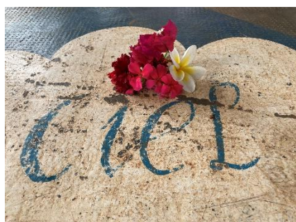
Une fleur dans le ciel EPFC CE1

Voici les 3 photos plébiscitées par le jury pour le CYCLE 2 (sans classement)