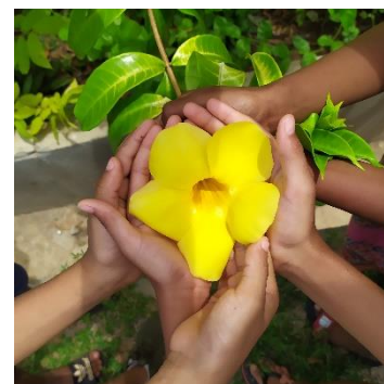
Une fleur qui rassemble CP-CE1 D Majunga

Cette photo raconte une histoire. Présence d'une légende Photo vivante grâce à la présence de personnages Belle composition avec le chevauchement de plans. Il y a de la recherche avec la taille de la fleur au 1 er plan qui paraît très grande, elle semble toucher les cheveux de l'enfant Belle lumière sur la fleur