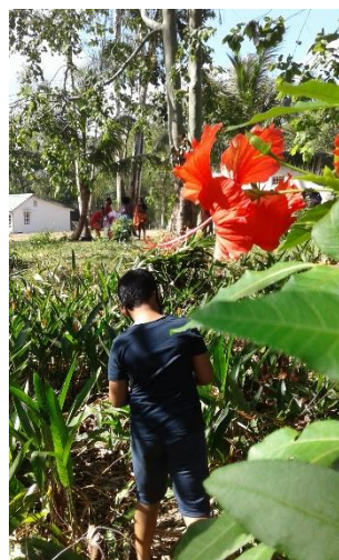
Fleur, couleur, bonheur CE2B Tamatave

Photo très esthétique Epurée, elle procure un sentiment de calme Il y a un beau travail de composition, de la recherche Belle harmonie et complémentarité des couleurs Présence d'une légende