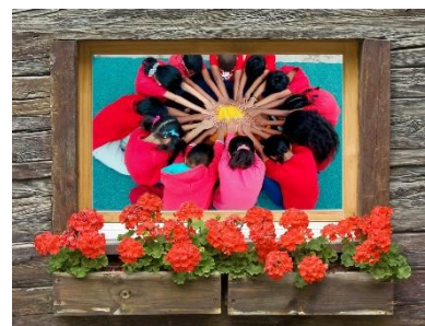
CM2 A La Clairefontaine Talatamaty