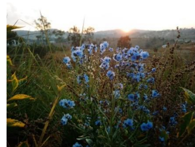
Les fleurs du printemps sont les rêves de l'hiver CM2 B BIRD